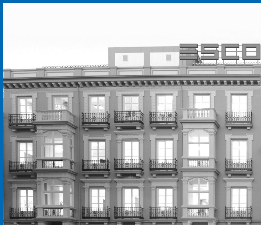
Campus ESCO-ESCAV - Granada

King Edward VII Avenue, Cathays Park Cardiff CF10 3NS wales.ac.uk uniwales@wales.ac.uk