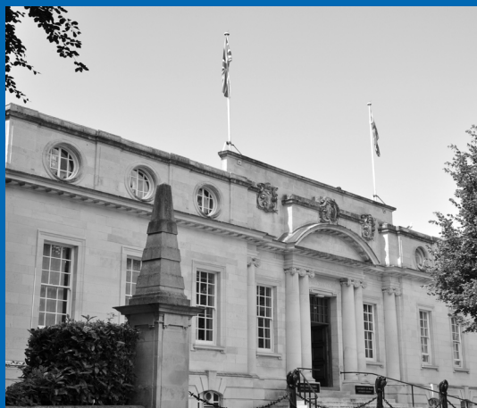
University of Wales - Cardiff

King Edward VII Avenue, Cathays Park Cardiff CF10 3NS wales.ac.uk uniwales@wales.ac.uk