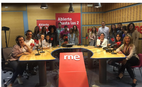
Estudio Radio Nacional

Las actividades y eventos programados fuera del aula tienen como objetivo conocer a las empresas y a las marcas desde dentro, y poner al alumno en contacto con la realidad más próxima. Estas actividades se complementan con un viaje de estudios en Madrid donde los alumnos visitan las principales agencias de Marketing y Publicidad y Medios de Comunicación.