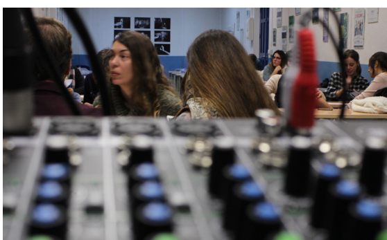
Taller de radio en ESCO