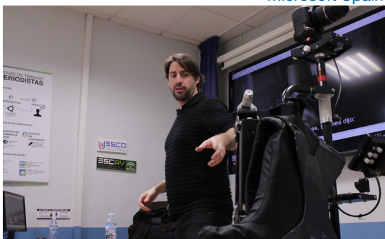
Taller de SteadyCam en ESCO